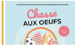
Inscriptions pour la chasse aux oeufs 2022