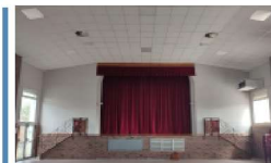
La rénovation de la salle des fêtes se poursuit